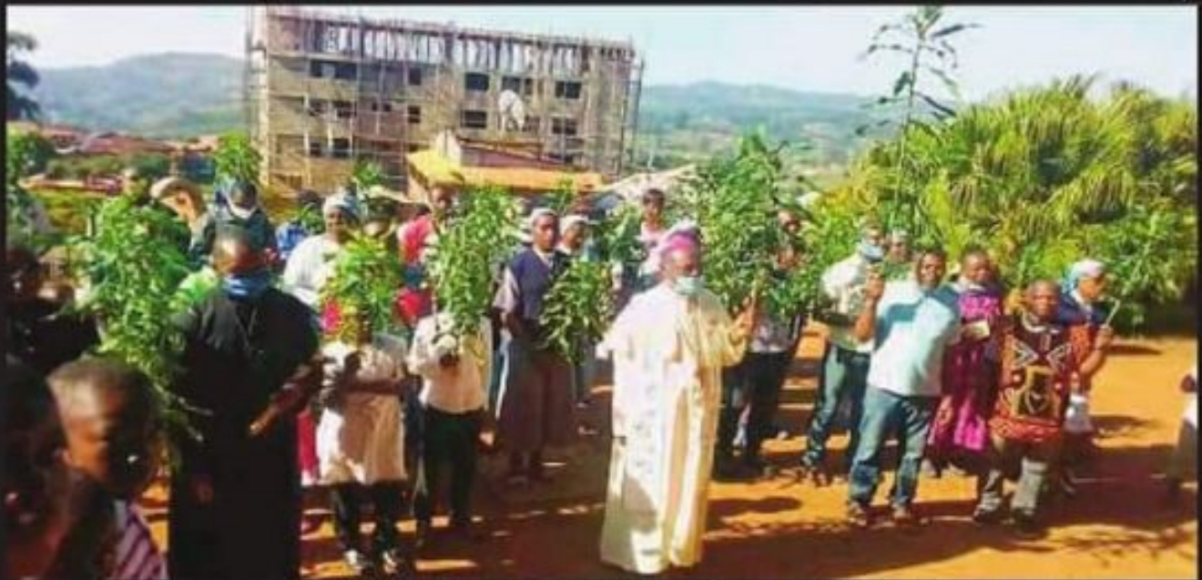
Mgr. Nkuo leading Christ's faithful in a march for the return of peace to his territorial circumscription

Gov't Begins Distribution Of Artemisia Plants For COVID-19 Treatment p 3