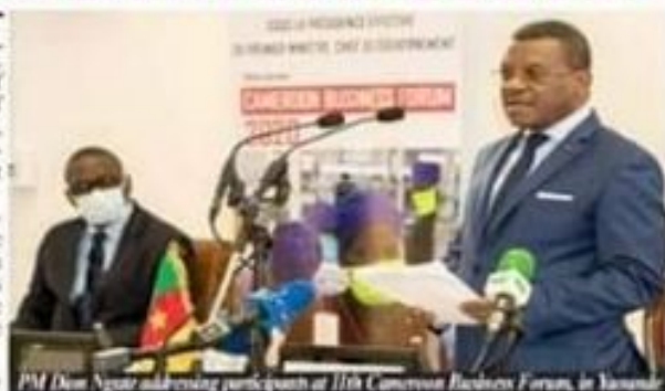
PM Dion Ngute addressing participants at 11th Cameroon Business Forum, in Yaounde

He was speaking yesterday October 23 while chairing the 11th session of the Cameroon Business Forum, which held at the auditorium of the Prime Minister's Office.