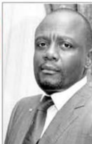
Pages 6 & 7

Des magistrats de la haute juridiction avaient couvert la falsification d'un acte de procédure pour favoriser le patron de leurs épouses. La fraude vient d'être sanctionnée après leur mise à la retraite.