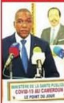
MINISTRE DE LA SANTÉ PUBLIQUE COVID-19 AU CAMEROUN LE POINT DU JOUR

Mafia et gabegie : Le Minsanté accusé de détournement