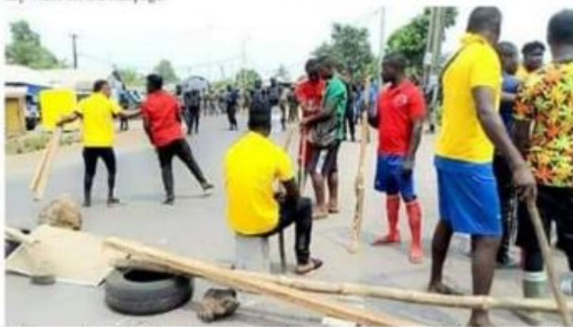
Irate ex-Amba fighters mount barricades on the streets of Buea yesterday