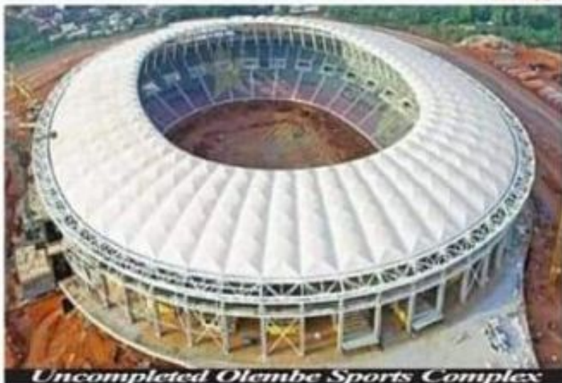
Uncompleted Olembe Sports Complex