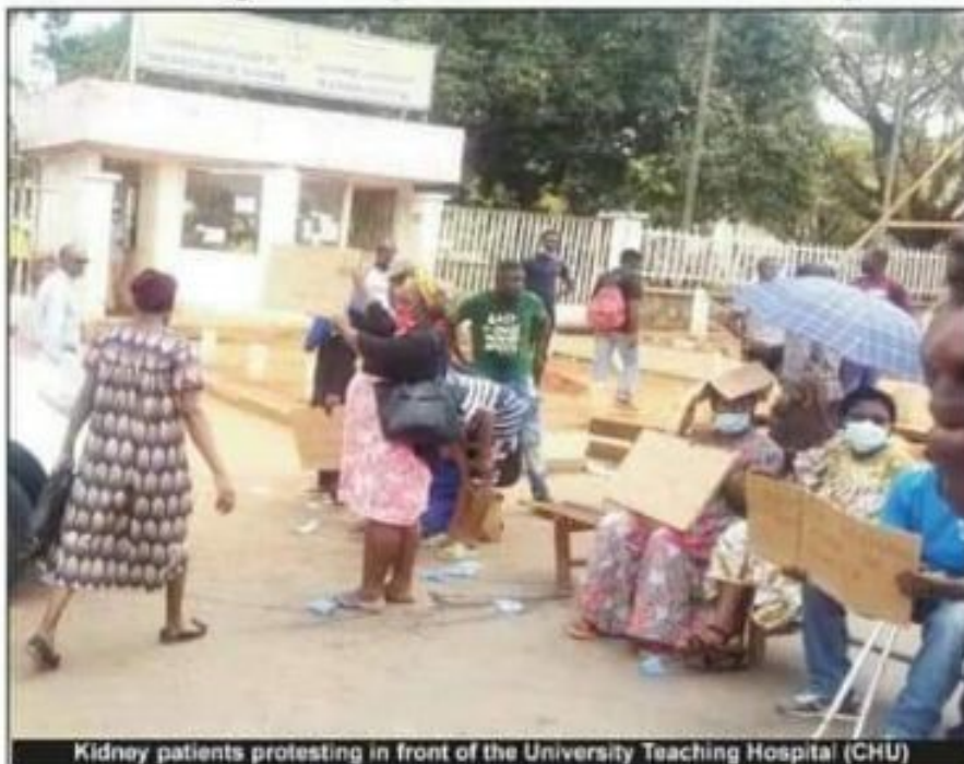
Kidney patients protesting in front of the University Teaching Hospital (CHU)