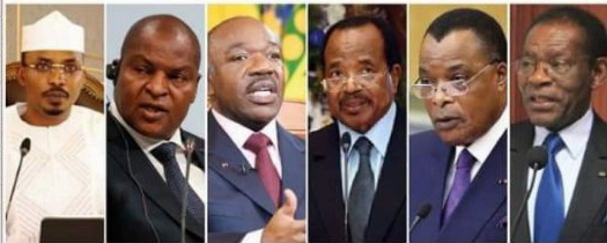
Illustration d'identités. Contenu d'identification. Image du site public. Analyse sous réserve.

■ Enquête sur la relance économique post-Covid. Lire le communiqué final à l'issue des travaux. Pp. 6-7