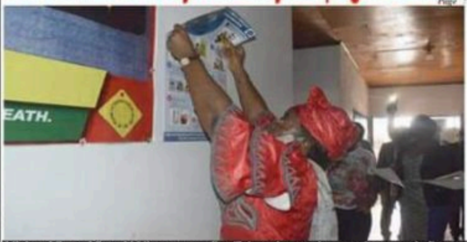
Minister Minette Libom Li Likeng personally affixing cybersecurity campaign poster in Bertoua